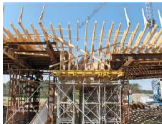
██████████ DB-Brücke Stockheim 02.06 Brodbeck, Metzingen BW8 Metzingen 03.06